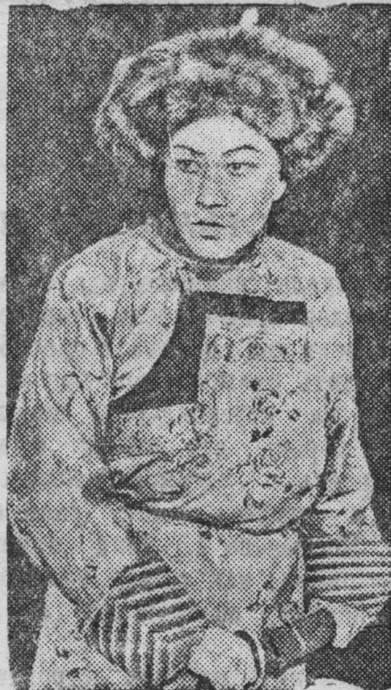
Заслуженный артист Бурят-Монгольской АССР В. К. Халматов в роли Баира в пьесе того же названия.

За высокие производственные показатели гвоздильный цех получил переходящее красное знамя ГУМПа Наркомчермета, которое обязуется держать в своем цехе и дальше. Ф.