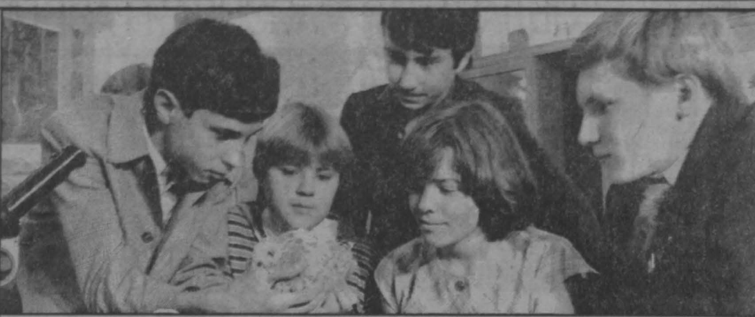
к 80-летию геологической службы Западной Сибири

Корр.: — Себестоимость — вот проблема. Сегодня экономика не позволяет всевозможным снижением себестоимости. Мы рады уже тому, что в крае есть вода. Но когда нибудь наступит другое время, и потребитель сможет платить дорого за качественную воду, но не станет покупать дорого плохую воду или платить за ее отсутствие.