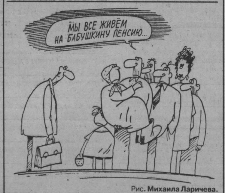
Рис. Михаила Ларичева.