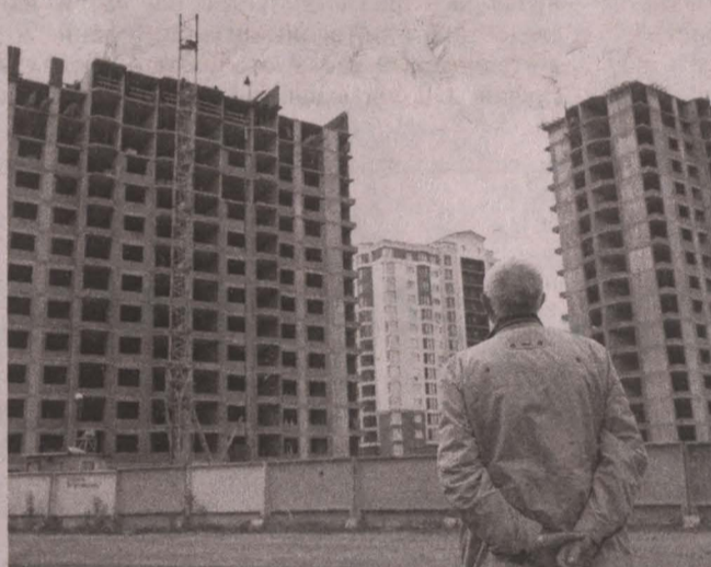
■ Нацпроект «Жилье и городская среда» поможет расселить более 500 кузбасских семей с площади в 7,67 тысячи аварийных квадратных метров.

Не обделена вниманием и городская транспортная инфраструктура: по линии нацпроекта профинансировали строительство двух дорог к новым микрорайонам Кемерово. И хотя основные объемы строительства в регионе приходятся на крупные агломерации, многоквартирные новостройки должны появиться и в территориях с незначительной долей городского населения: в рамках нацпроекта необходимо расселить из аварийного жилья