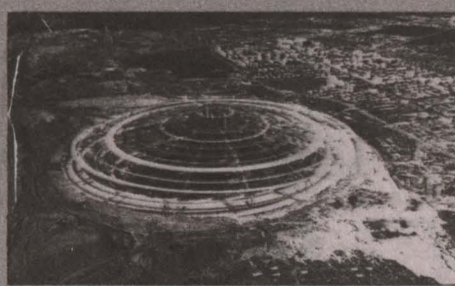
Это не реальное фото, а пока лишь проект города под куполом на месте карьера Мир в Якутии.

А почему бы не рассмотреть вариант города под куполом на месте каногни-будь отработанного кузбасского разреза? Наши угольщики на этот вопрос пока говорят: «Фантастика». А вот наши ученые не столь категоричны: «Почему бы и нет? Там могут быть свои плюсы и минусы, но тему надо исследовать. К тому же такие города под куполом, которые со временем могут появиться на Земле, в