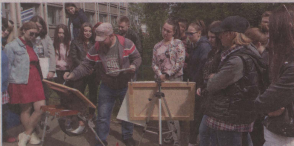
■ Мастер-класс для будущих архитекторов.