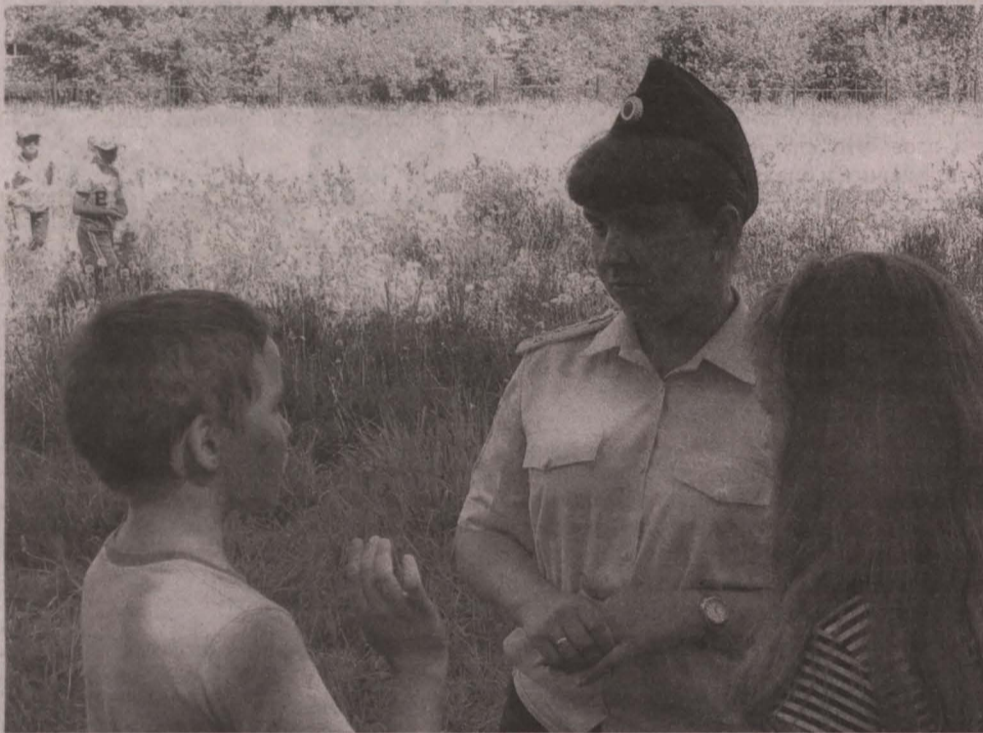
■ Практика показывает: свести количество несчастных случаев с детьми до минимума удастся лишь там, где практически ежедневно ведется работа по их профилактике.

Родителям всегда следует стремиться знать окружение ребенка, с кем и где он гуляет, категорически запрещать посещение опасных объектов (например, заброшенных зданий и железнодорожных мостов). Необходимо помнить и о требованиях так называемого «комендантского часа для детей», когда поздно вечером и ночью несовершеннолетним нельзя находиться в общественных местах без сопровождения родителей, опекунов или иных законных представителей (с 1 ноября по 31 марта это время с 22.00 до 06.00, с 1 апреля по 31 октября – с 23.00 до 06.00). За нарушения этих требований предусмотрена административная ответственность.