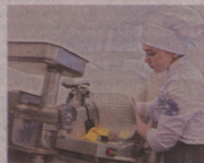
■ Фото департамента образования и науки Кемеровской области.

Вместо билета с теоретическими вопросами студенты получают практическую задачу, которую необходимо решить. Аттестация охватит