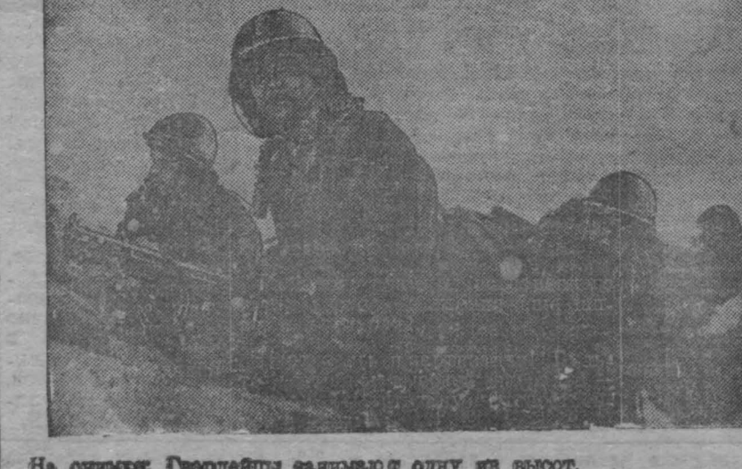
На овражке Гавридей занято от одной из высот.