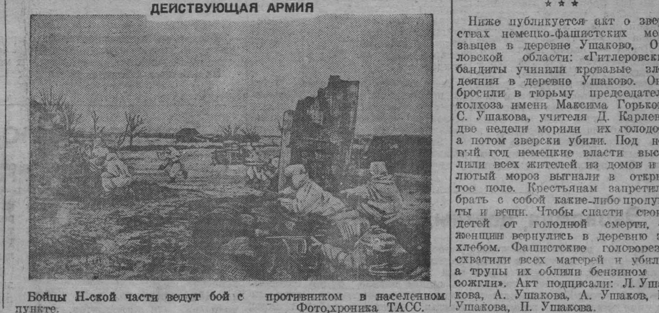
Бойцы Н.-ской части ведут бой с противником в населенном пункте.